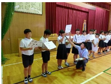
【平和への誓いを発表】