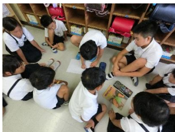
【平和への誓いを考える】