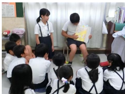
【6年生による読み聞かせ】

平和記念式典視聴後は、なかよし班(縦割り班)ごとに各教室へ移動し、6年生が自分たちで選んだ平和に関する絵本の読み聞かせを行いました。読み聞かせの後には平和への誓いを班全員で考え、メッセージボードに書きました。その後、体育館に集まり、